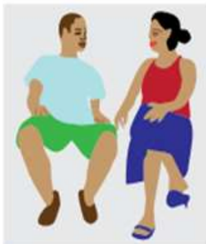
Contactos personales. Boca a boca con amigos/familiares o conocidos