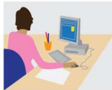
Bolsa de trabajo (presentar directamente tu candidatura donde exista un posible puesto de trabajo)