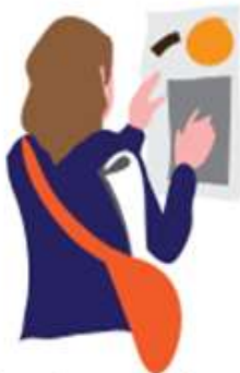
Anunciarse uno mismo