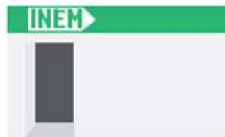
Oficinas del INEM