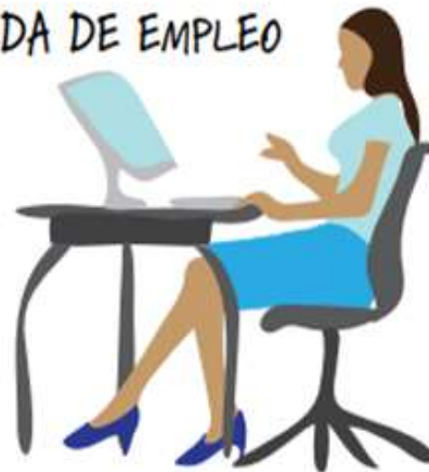
Agencias privadas de colocación