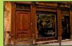
casa de antigüedades