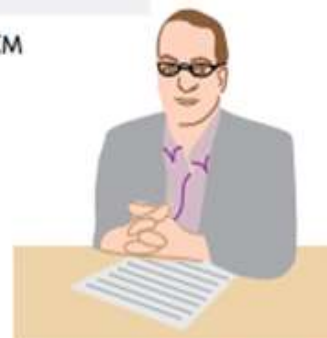
Empresas de selección de personal