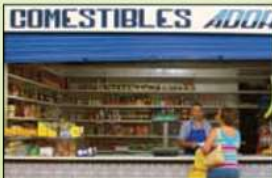
La tienda de comestibles