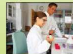
sala de curas/enfermería