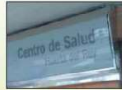
centro de salud