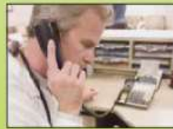
servicio de atención al cliente