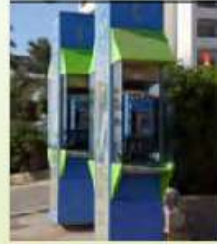
Cabina de teléfonos