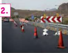
Señalización circunstancial que modifique el régimen normal de utilización de la vía y señales de balizamiento fijo