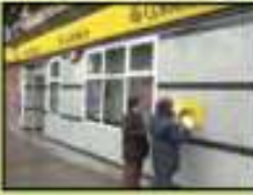
Correos y telégrafos