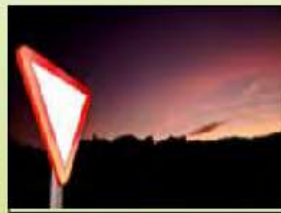
Ceda el paso/ señales de tráfico