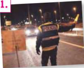
Señales y órdenes de los agentes de circulación