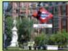
Estación de metro