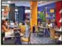
Agencia de viajes

EDIFICIOS, ESTABLECIMIENTOS, QUE SE PUEDEN ENCONTRAR EN UNA CIUDAD