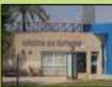
Oficina de turismo