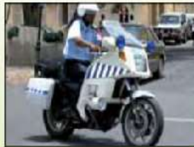
Agentes de policia