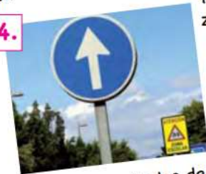
Señales verticales de circulación