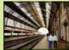
Estación de tren