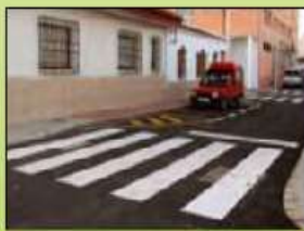
Paso de peatones/ marca vial