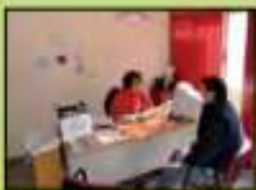
Oficina de información