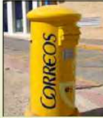
Buzón de correos