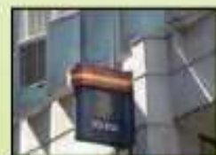
Comisaria de policia