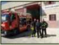
Bomberos (Parque de bomberos)