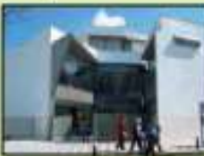
Centro de salud