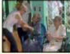
Residencia de ancianos