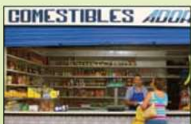
La tienda de comestibles