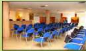
El salón de actos