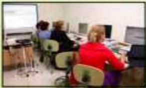
El aula de informática