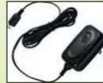
cargador del móvil