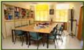
La sala de profesores