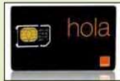
tarjeta de teléfono